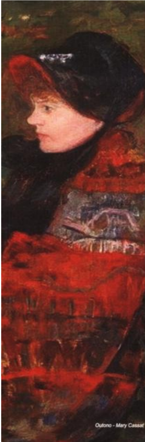
Autono - Mary Cassatt