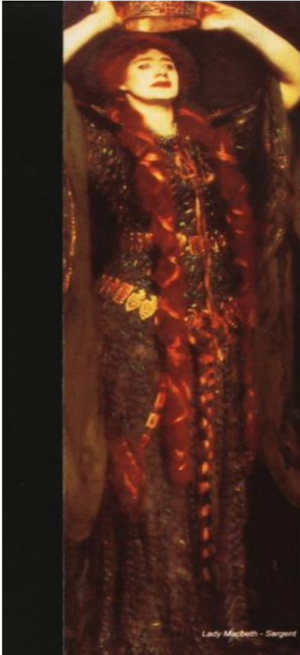
Lady Macbeth - Sargent