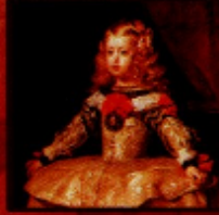
Diego Velázquez "Retrato de Inês de Castro", c. 1656 Óleo sobre tela, 105 x 108 cm Viena, Kunsthistorisches Museum