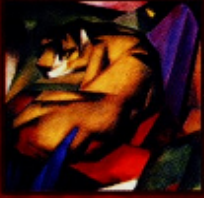
Franz Marc "O Tigre", 1912 Óleo sobre tela, 11 x 11 cm Munique, Staatliche Galerie im Lenbachhaus