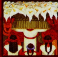
Diego Rivera "Festa de Flores: rua de Santo Agostinho", 1931 Enchilada sobre tela, 26 x 35,5 cm Nova York, The Museum of Modern Art.