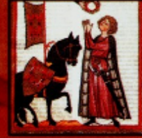
The Master of the Book of Hours "Um cavaleiro e sua esposa", século XIII Inks on parchment, Heidelberg