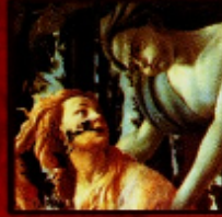
Sandro Boticelli "A Escrava" (jornal), c. 1482 Tempera sobre madeira de ébano, 28 x 34 cm Florença, Galleria degli Uffizi