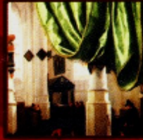
Honorata Cornelius, von - 1917 "Anexo do Grupo Waga, festa após o jantar de São Agostinho", 1952-53. Óleo sobre madeira, 26,2 x 35,1 cm Rio de Janeiro, coleção particular