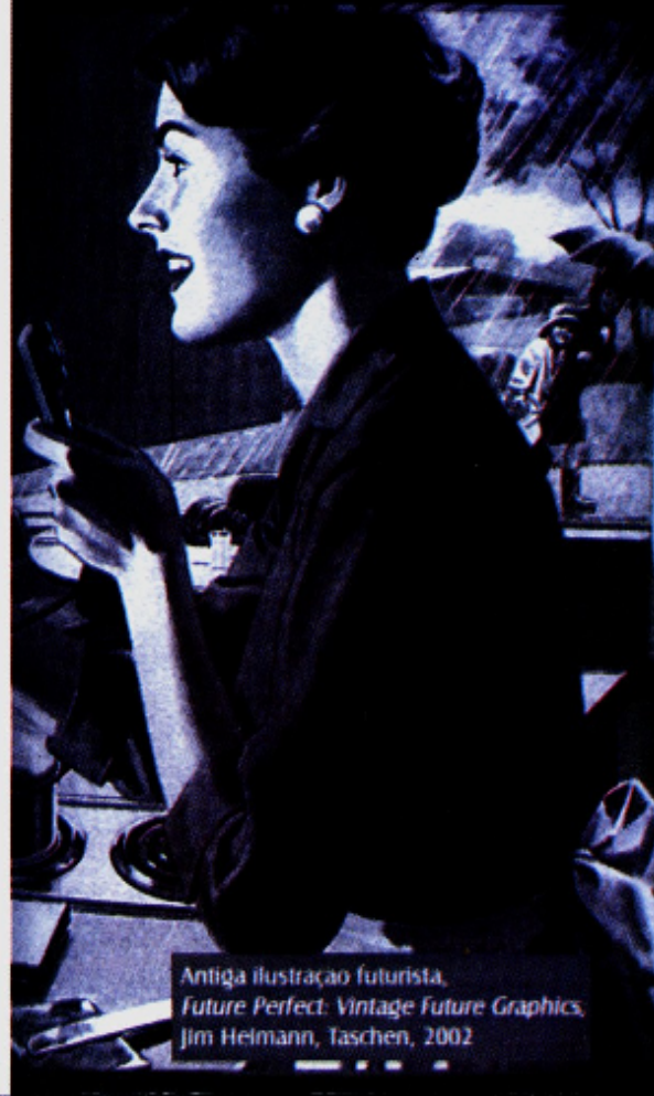
Antiga ilustração futurista, Future Perfect: Vintage Future Graphics , Jim Helmann, Taschen, 2002