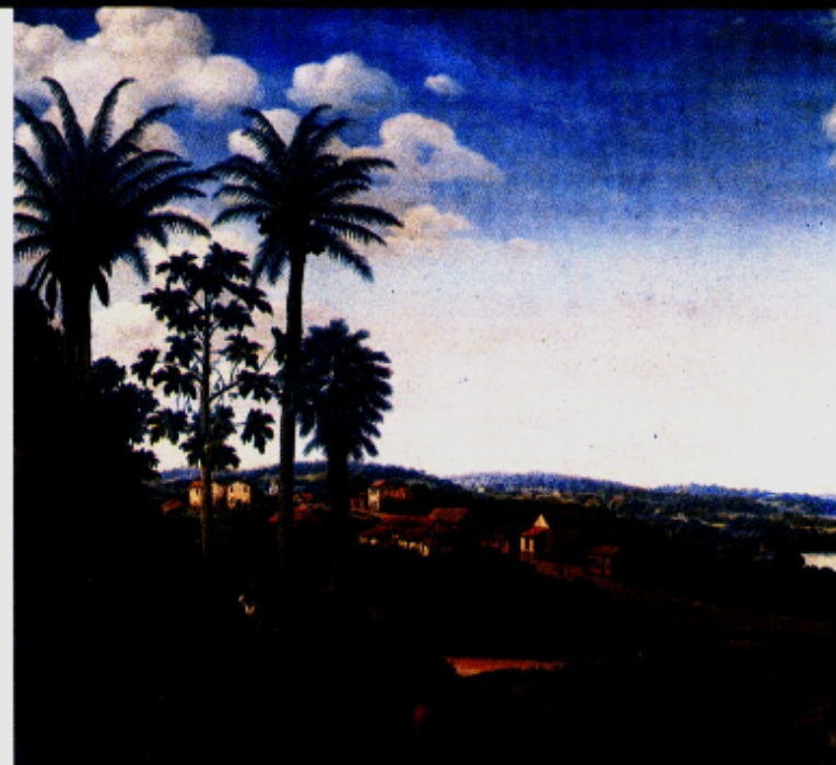
Franz Post Le Village de Serinhaem au Brésil Musée du Louvre, Paris