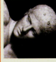
Myron (Miron) , O discóbulo , 460-450 a.C. Museu Nacional, Roma