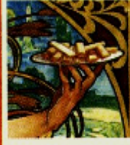
Alphonse Mucha Biscoitos Lefèvre-Unité , 1897 Pôster publicitário