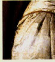
Francesco Hayez , O Beijo , 1859 Óleo sobre tela Pinacoteca de Brera, Milão