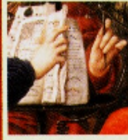
Edward Burne-Jones Laus Veneris , 1869 Óleo com tinta de ouro sobre tela, 122 x 183 cm Laing Art Gallery, Newcastle upon Tyne