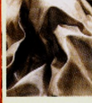
Gian Lorenzo Bernini O Êxtase de Santa Teresa , 1652, Santa Maria della Vittoria, Roma