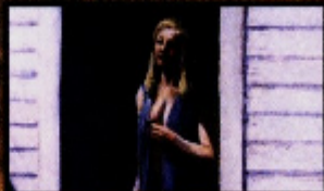
EDWARD HOPPER HIGH NOON , 1949 Óleo sobre tela The Dayton Art Institute, Dayton, EUA