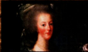
ELIZABETH LOUISE VIGÉE LE BRUN MAE ANTONIETTE À LA ROSE , 1785 Óleo sobre tela Palácio de Versalhas, França