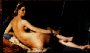
JEAN-AUGUSTE DOMINIQUE INGRES A GRANDE ODALISCA , 1814 Óleo sobre tela Museu do Louvre, Paris