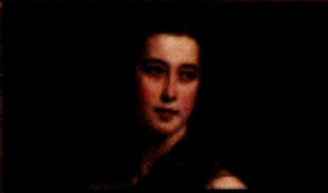
FRANZ XAVER WINTERHALLER MAE BARBE DE RIMSKY-KORSKOV , 1864 Óleo sobre tela, Musée d'Orsay, Paris