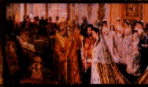
LAURITS RIGNER TUXEN O CASAMENTO DO IMPERADOR NICOLAU II E DA IMPERATRIZ ALEXANDRA FEODOROVNA , 1895 Óleo sobre tela Museu Hermitage, S. Petersburgo, Rússia