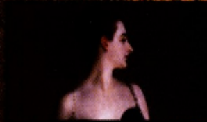
JOHN SINGER SARGENT MADAME X , 1884 Óleo sobre tela The Metropolitan Museum of Art, EUA