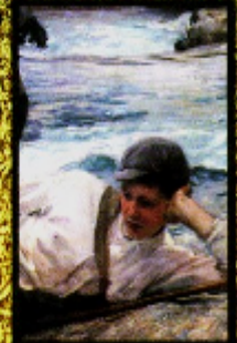
On his holidays (1901) John Singer Sargent óleo sobre tela Lady Lever Art Gallery, Port Sunlight, Inglaterra