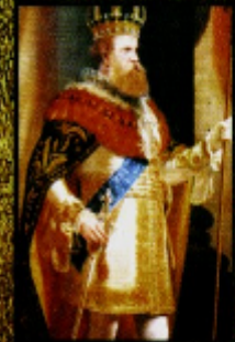
D. Pedro na abertura da Assembleia Geral (1872) Pedro Américo de Figueiredo óleo sobre tela Museu Imperial de Petrópolis, Petrópolis, RJ - Brasil