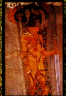
Friso Beethoven (1902) Gustav Klimt tátil Viena, Áustria