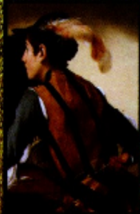
Os Trapaceiros das cartas (1564) Michelangelo Caravaggio óleo sobre tela Kunsthof Art Museum, Fort Worth, Texas, EUA