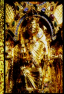
Tumulo de Carlos Magno (1564) Cabral de Aachen Zürich, Alemanha