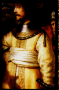
A Ronda Noturna (1642) Rembrandt van Rijn óleo sobre tela Rijksmuseum, Amsterdã, Holanda