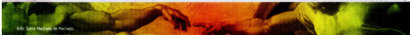
Arte: Samir Machado de Machado