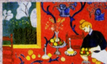
Henry Matisse Harmonia em Vermelho , 1908 Museu Hermitage, São Petersburgo