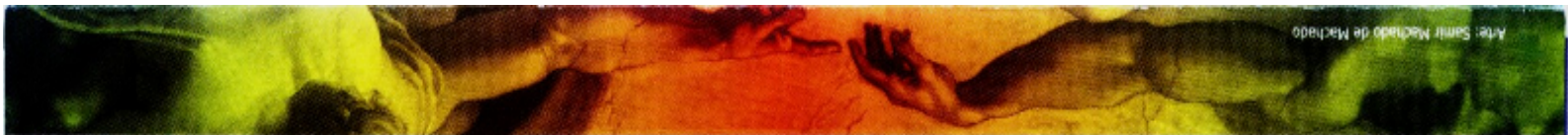
Arte: Saint Michado de Michado