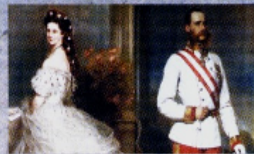
MONTAGEM SOBRE OBRAS DE Franz Xaver Winterhalter Imperatriz Elizabeth , 1854 Imperador Franz Joseph , 1865 Hofburg, Viena