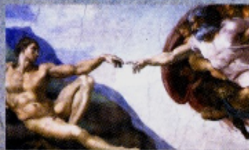
Michelangelo Deus criando Adão , 1508-12 Capela Sistina, Vaticano.