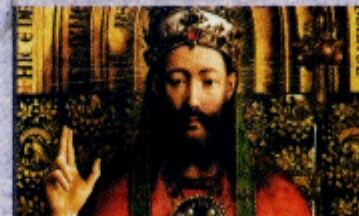
Jan Van Eyck Deus Todo-Poderoso , 1426-27 Catedral St. Bravo, Ghent, Bélgica.