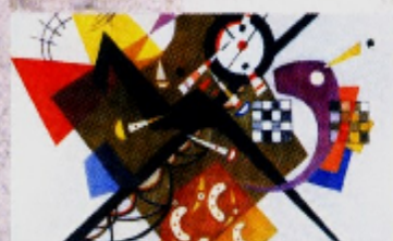
Wassily Kandinsky On White II , 1923 Musee National d'Art Moderne, Centre George Pompidou, Paris

Pontifícia Universidade Católica do Rio Grande do Sul Pró-Reitoria de Extensão Cursos Integrados de Artes