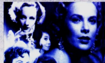
MONTAGEM SOBRE FOTOS (EM ORDEM): Marlene Dietrich, Grace Kelly, Cary Grant, Carmem Miranda, Marlon Brando, Marcello Mastroianni, Elizabeth Taylor e Fernanda Montenegro.