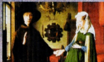
Jan van Eyck O Casal Arnolfini , 1434, National Gallery, Londres.